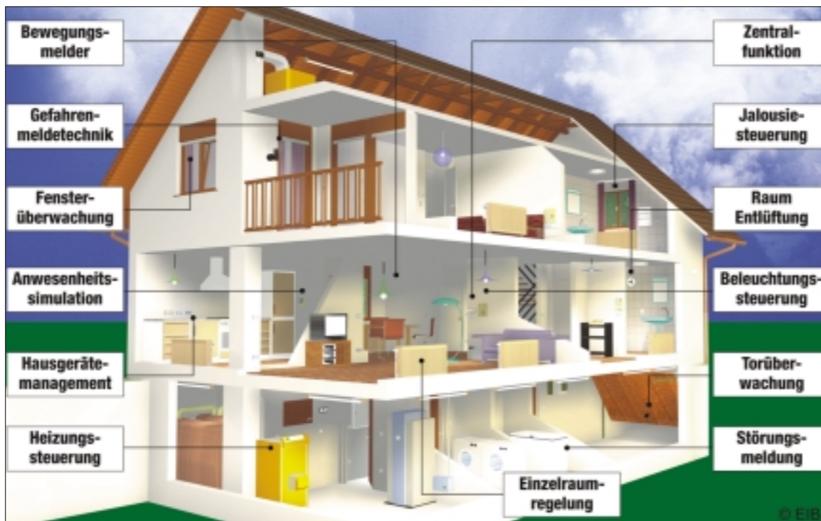
Heimautomatisierungssysteme vernetzen die Geräte und Installationen in einem Haus zu einem intelligenten Gesamtsystem

Derzeit liefern über 110 namhafte Hersteller rund 5000 verschiedene EIB-kompatible Produkte. Durch die große und ständig wachsende Verbreitung des EIB-Standards ist außerdem gewährleistet, dass auch zukünftig das Produktspektrum ständig erweitert und erneuert wird.